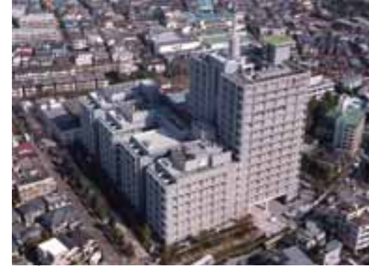
(財)NHK放送研修センター (NHK放送技術研究所ビルの9階～12階)