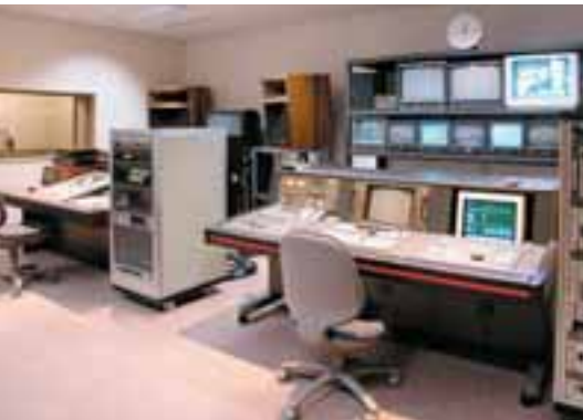
制作実習室 最新のデジタル技術を駆使した映像と音声の制作システム2式を整備しています。