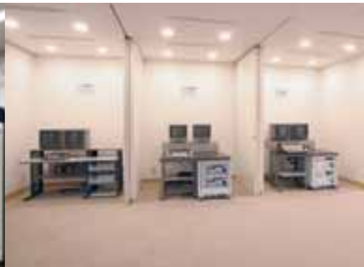
編集実習室 多くのビデオ編集を可能とするため、リニア方式からノンリニア方式まで多種の編集機を用意しています。