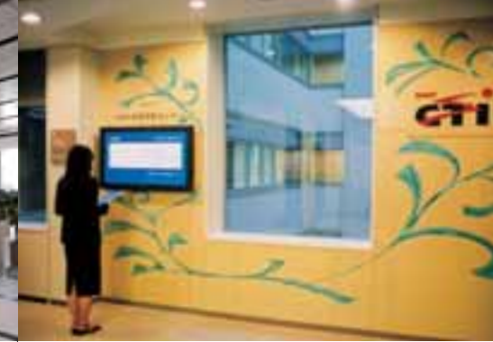
研修フロアエントランス(9階～12階) 研修フロアの各階入口には、研修案内用に研修教室等を表示したディスプレイを設置しています。