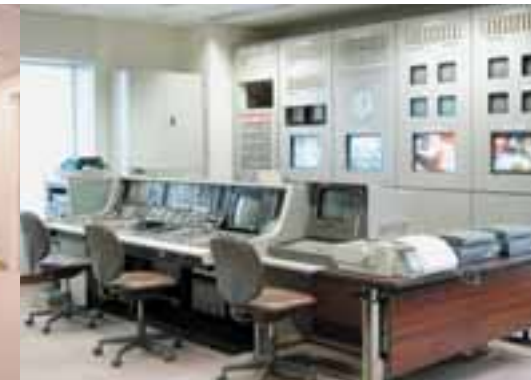
運行実習室 放送局用の運行設備があり、オペレーションの習熟や、放送障害時のバックアップなど運用訓練が可能です。