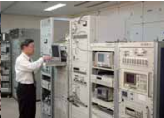
送信実習室 地上デジタル送信機、テレビ送信機、FM送信機、AM送信機があり、送信機の調整からメンテナンスまでを実習できます。