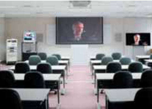
研修室 大小の各研修室には、平面ディスプレイ(プラズマディスプレイパネル)やモニターが整備されており、大画面・高画質のハイビジョン映像などを利用することができます。