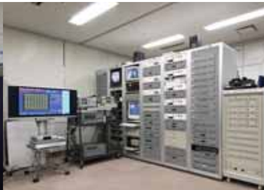
受信・CATV実習室 CATV局の再送信など受信技術の実習室です。光伝送やデジタル衛星放送の伝送も可能となっています。また、地上デジタル放送のシミュレーション実験装置も整備されています。