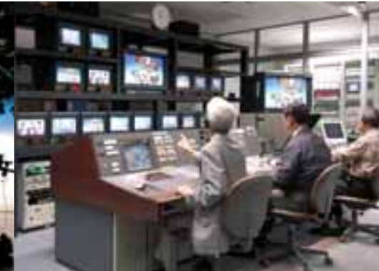
ハイビジョンノンリニア/VTR実習室 ハイビジョン編集機は、放送のハイビジョン化という時代の要請に応えるもので、最新の設備による研修を実施しています。